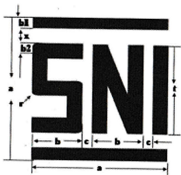
Gambar 2. Ukuran Tanda SPPT SNI